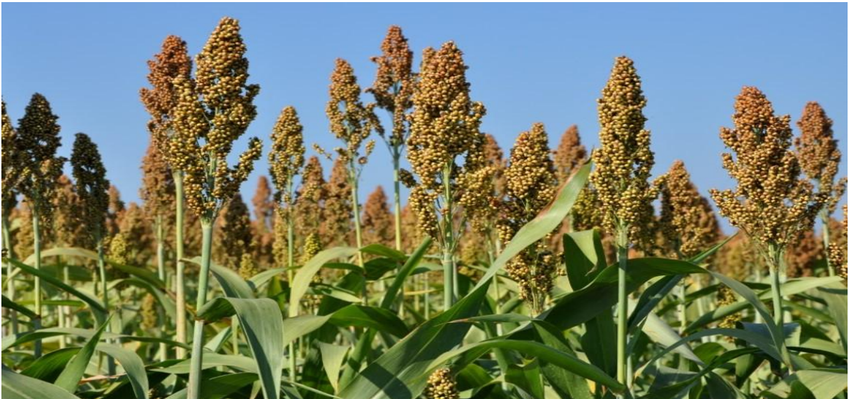
(Croquis de pied de sorgho)

Le sorgho est une céréale , c'est-à-dire une plante qui produit des grains, annuelle très répandue en Afrique.