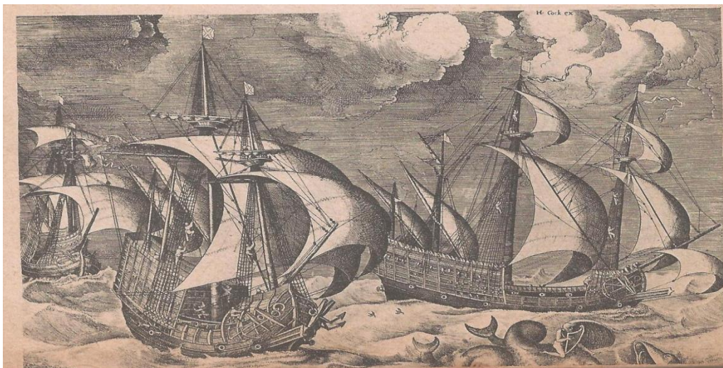
Les Caravelles, (d'après Brueghel).

Après les côtes du Sénégal et de la Guinée, les Portugais atteignent en 1471 l' Equateur . Enfin en 1488 , Barthélemy Diaz double le cap de Bonne-Espérance et, 10 ans plus tard , Vasco de Gama remonte la côte orientale d'Afrique, entre en contact avec les Etats musulmans et, dirigé par un pilote arabe, arrive aux Indes (1498) .